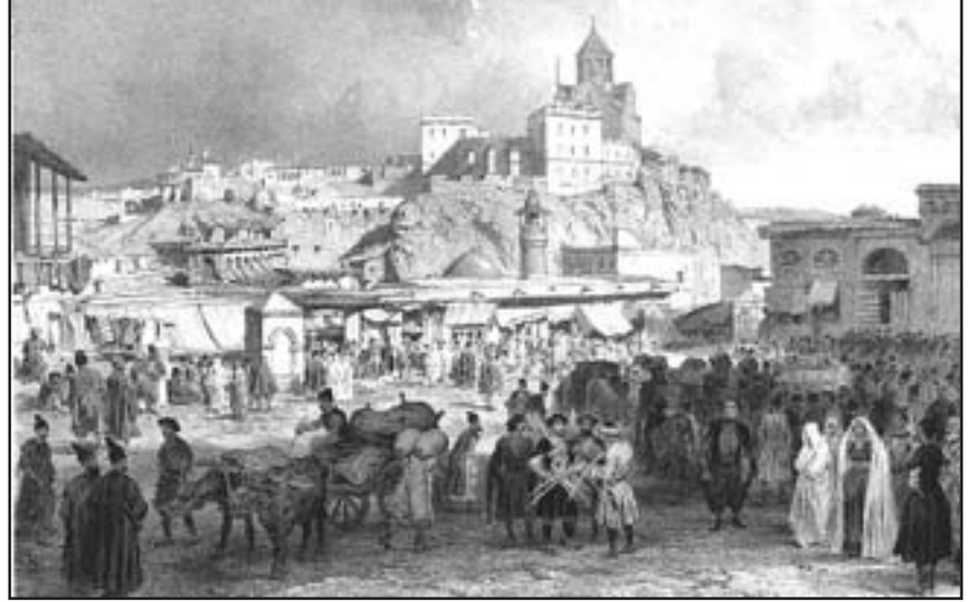
Григорий Гагарин. Тифлис. Майдан