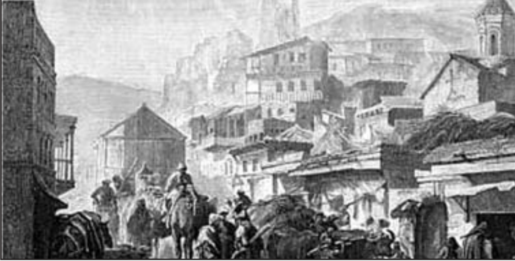
Улица в Тифлисе (original wood engraving drawn by Ronjat, engraved by Hildibrand. 1878.)