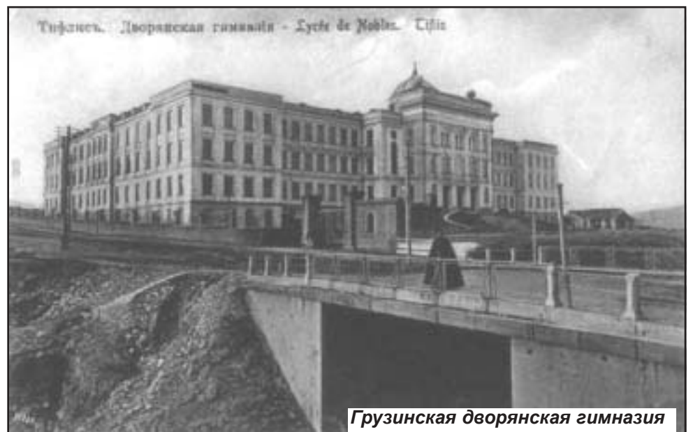
Грузинская дворянская гимназия