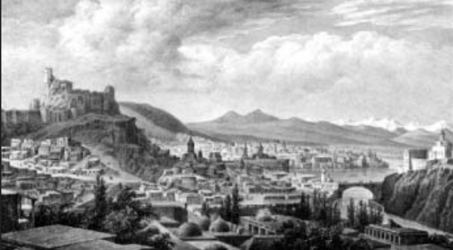
Вид Тифлиса середины 19-го века. Литография Жакоте.