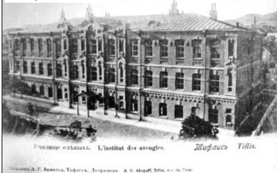
Училище слепых. L'Institut des aveugles. Тифлисе Tiflis.

Тифлисе А. Г. Авагян, Тифлис, Грузия. А. С. Акараш, 1906, № 18, 780