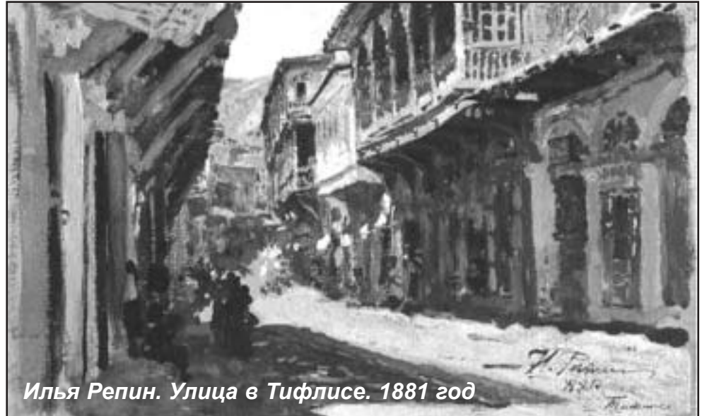
Илья Репин. Улица в Тифлисе. 1881 год