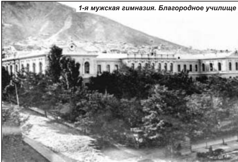
1-я мужская гимназия. Благородное училище

Старейшее в Тифлисе общеобразовательное учреждение для мальчиков появилось уже в первые годы 19 века. 24 января 1803 г. Александр I утвердил "предварительные правила народного просвещения", 5 ноября 1804 г. вышел "Устав учебных заведений", "подведомых университету и попечителям округов". Новые учебные заведения были рассчитаны на 4-годичных курса. Цель их учреждения в "Уставе" определялась так: "1) приготовить к слушанию университетских наук; 2) преподавать сведения, необходимые для благовоспитанного человека и 3) приготовить желающих к учительскому званию в уездных, приходских и других низших училищах. Согласно этой цели и план учения заключал в себе начальные основания всех наук". План этот был составлен по образцу французских лицеев и имел целью упорядочение работы вновь открывающихся гимназий.