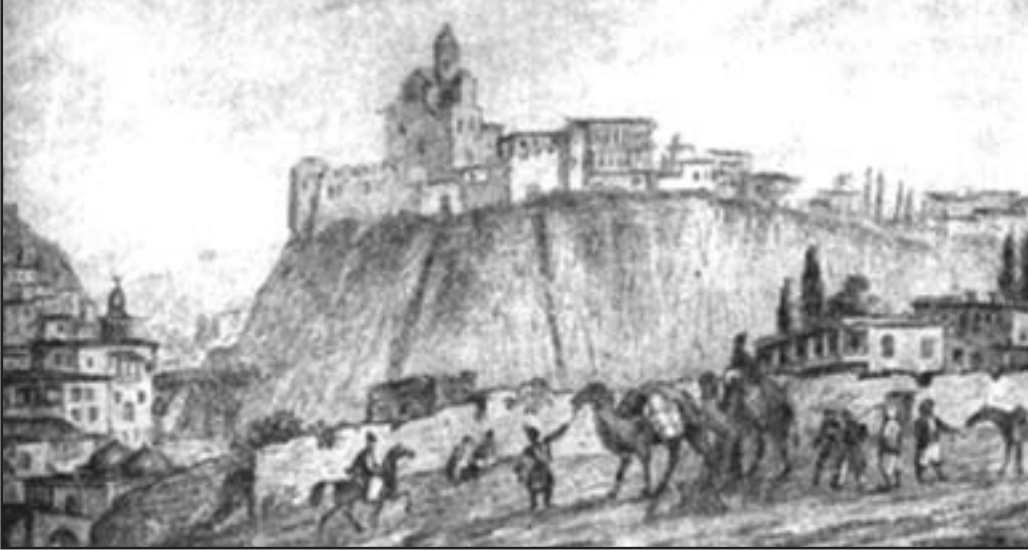
Тифлис. Рисунок Михаила Юрьевича Лермонтова