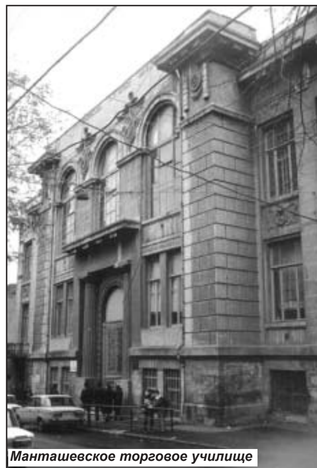
Манташевское торговое училище