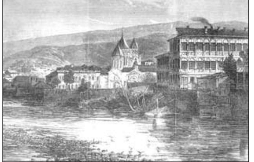
Тифлис. Армянская церковь Паша-Банк